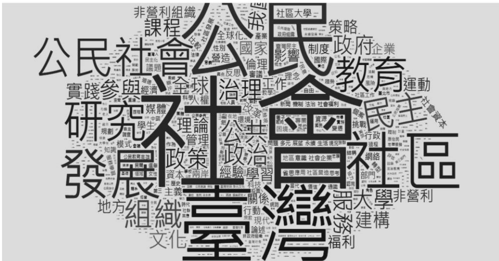
圖三：1987至2020年有關臺灣公民社會研究的文章主題斷詞文字雲